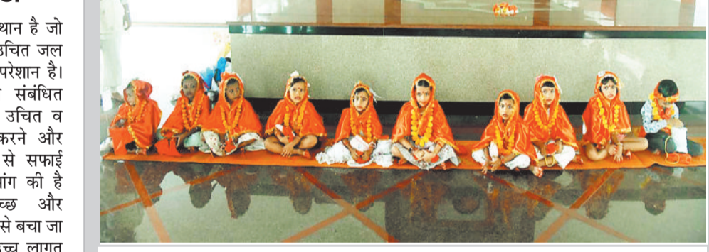
रायगढ़। अघोर गुरु पीठ ट्रस्ट बनोरा की मुख्य शाखा बनोरा में शारदीय नवरात्रि में नवमी के दिन नौ कन्याओं भोजन करवाया गया। इसके पश्चात आयोजित भंडारे में आस पास के ग्रामीणों सहित शहर के गणमान्य लोगों ने प्रसाद ग्रहण किया।